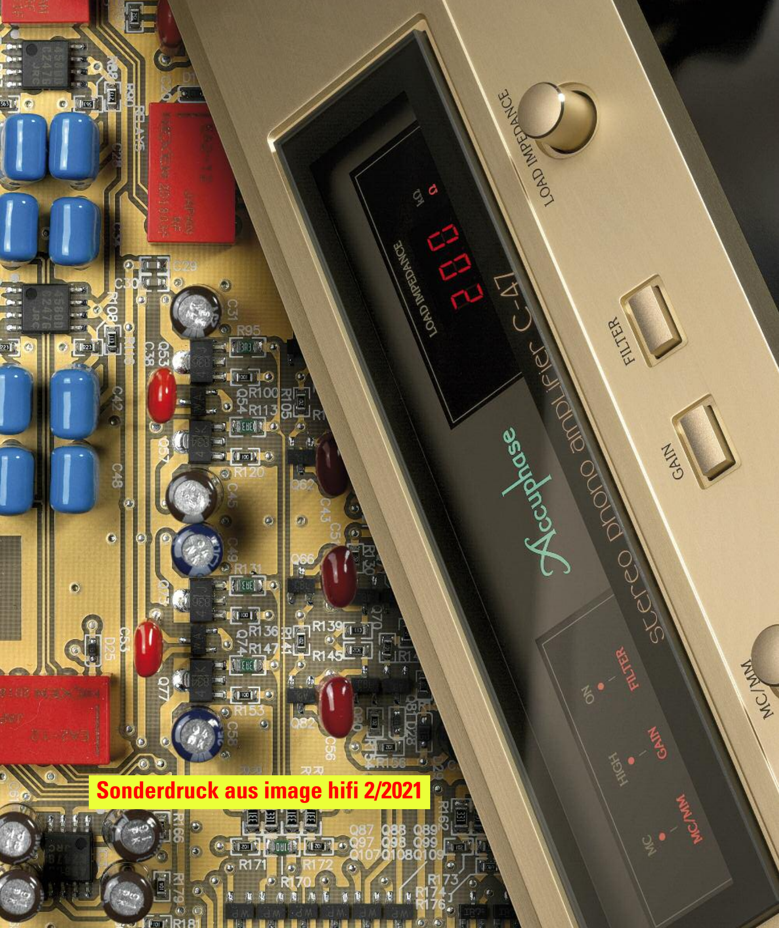
Sonderdruck aus image hifi 2/2021