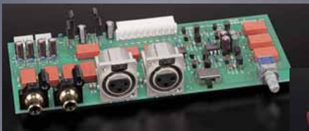
Auf der Baugruppe mit den Eingängen (o.) schalten kleine Relais zwischen Cinch und XLR um. Die großen Drehklemmen (r.) nehmen fette Querschnitte, Gabelschuhe oder Bananas auf. Auch auf der Rückseite bietet die P-6100 Griffe

Wir haben den C-3800 auf seiner mittleren Verstärkung (18 Dezibel) arbeiten lassen, in der dieser ebenso entspannt wie feinnervig tönt, und auch die Endstufe relativ unempfindlich geschaltet. Denn warum soll man die satte Ausgangsspannung des DP-700 in der Vorstufe erst bei hoher