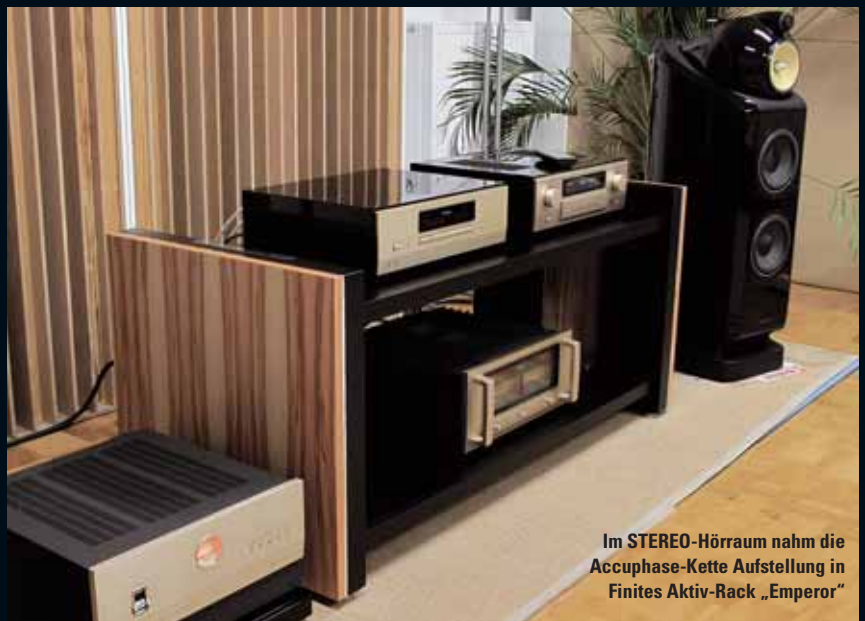
Im STEREO-Hörraum nahm die Accuphase-Kette Aufstellung in Finites Aktiv-Rack „Emperor“

High End-Business as usual also bei Accuphases neuem Endverstärker? Nicht ganz, denn es gibt eine wichtige Änderung im Vergleich zu den anderen Modellen P-4100 und P-7100, durch die die Japaner die P-6100 an ihre großen Mono-Amps M-6000 anlehnen und zugleich die Brücke zwischen ihren Class-AB- und Class-A-Verstärkern schlagen. So arbeitet die P-6100 wie Letztere und die Monos statt